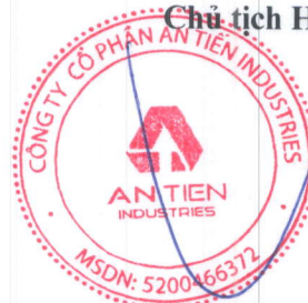
Đinh Xuân Cường